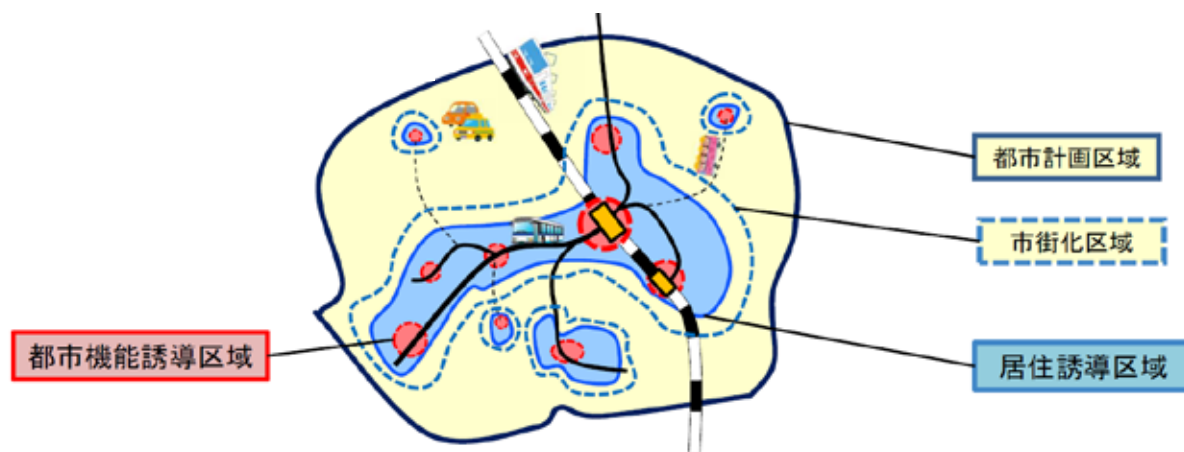
立地適正化計画制度のイメージ図

このため、都市再生特別措置法が改正され、行政と住民や民間事業者が一体となったコンパクトなまちづくりを促進するため、立地適正化計画制度が創設されました。