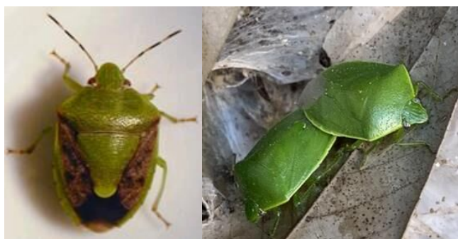
写真1 左:チャバネアオカメムシ成虫、右:ツヤアオカメムシ成虫