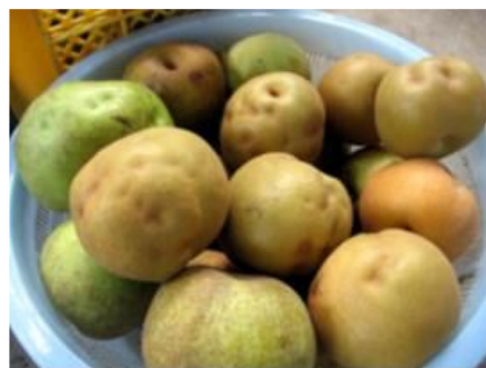
写真2 被害を受けたなし