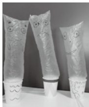
▲はるだおきなさい ▲モコモコクン