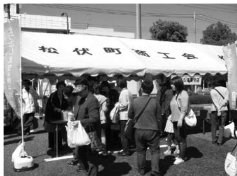
昨年の特産品フェア

また北海道出身の男性6人組プロのアカペラグループ「JARNZΩ(じゃ～んずΩ)」がやってきます。声だけで作り上げる圧巻の演奏をぜひご覧ください。