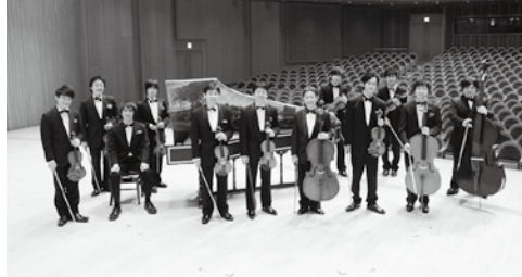
東京ヴィヴァルディ合奏団