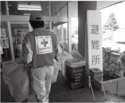
平成25年9月の竜巻災害時に施設へ布団を運び込む日赤

いまでも、これからも。そのときすぐに駆けつけるために。赤十字社資募集にご協力を！