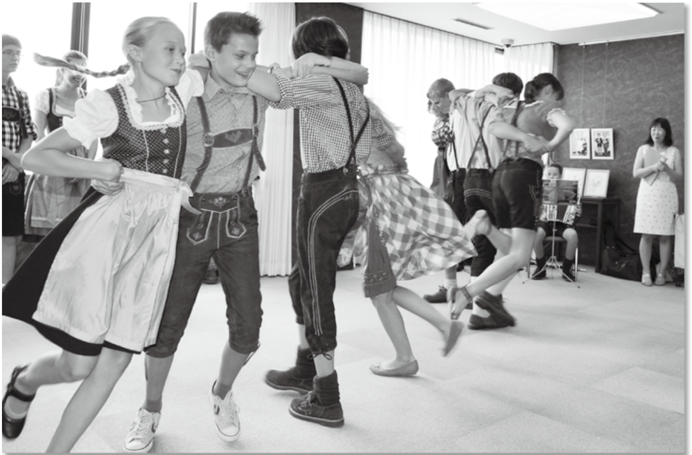
民族舞踊と演奏を披露するグライスドルフ市の中高生(役場応接室) ▶詳細は7ページ