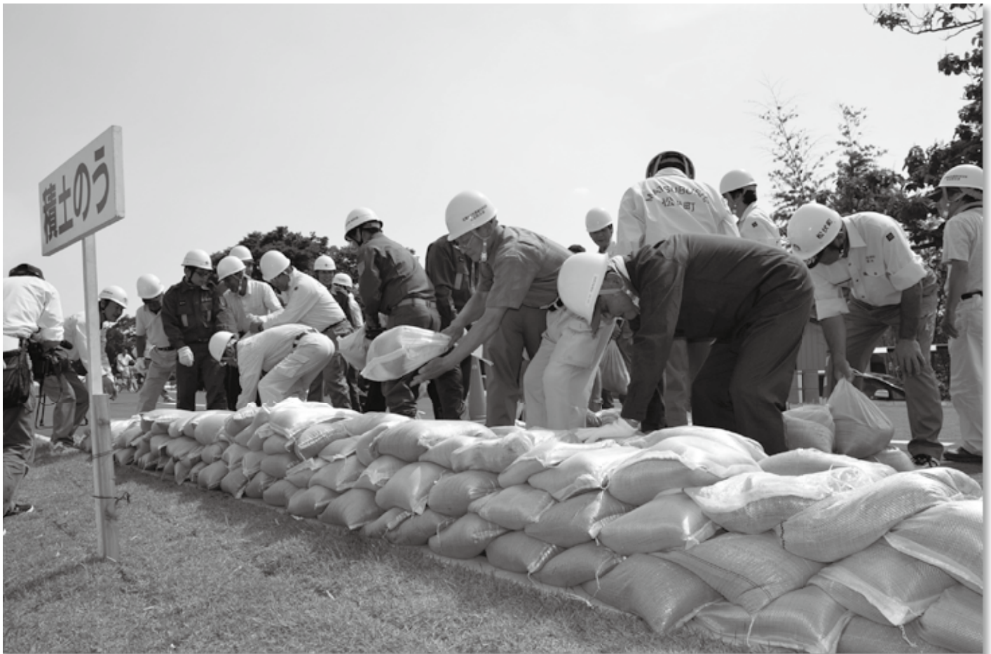
出水期に備え、江戸川水防演習を行いました (町営運動場) ▶詳細は9ページ