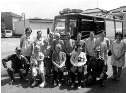
吉川松伏消防組合の皆さんと 避難訓練