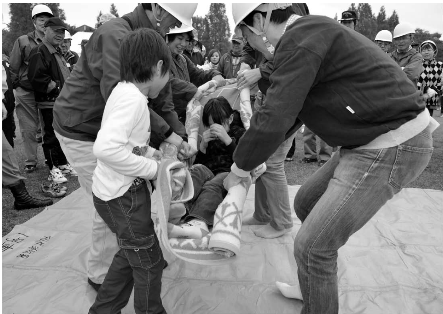
松伏記念公園で、町及び関連機関、地域住民が参加し、防災訓練を実施しました。【11月11日】 ▶詳細は10ページ