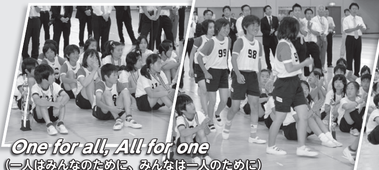
One for all, All for one (一人はみんなのために、みんなは一人のために)