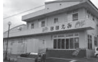
学校給食センターほほえみ