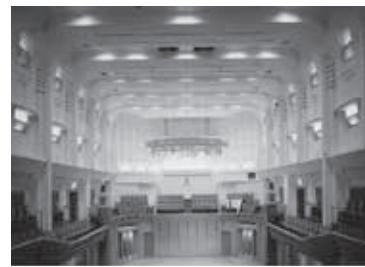
田園ホール・エローラ