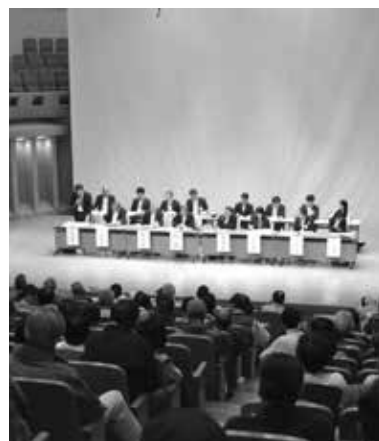
(令和元年度の様子)