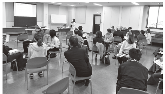
松伏町人権セミナー