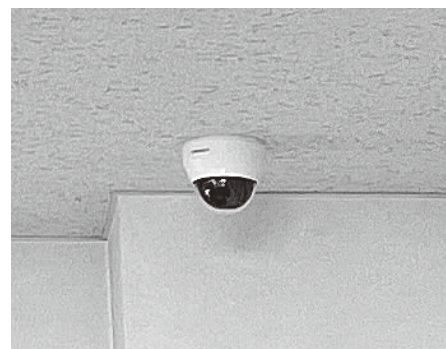
「ふれあいセンターかがやき」1階多目的室内に設置されている防犯カメラ

用している。③防犯カメラの取扱いは、指定管理者職員等の裁量により制御するといった柔軟な運用は排除すべきであり、定点カメラで24時間連続して撮影することが必要であると考えている。防犯カメラを設置している施設であることを利用者に理解していただき、適正な施設管理を行う。