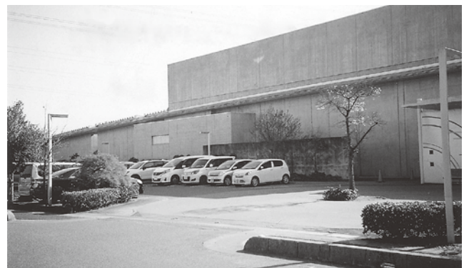
年間約20万人利用している杉戸町立図書館

のを見つけ出し、吸収していく。地域に根差した図書館が必要である。町はどの様を考えているか。 答 町長 町民から要望が出ていることは、認識している。図書館があったらいいなと思っている。しかし、当面は保健センターの建設等があるので、町民の健康に即したほうを優先する。