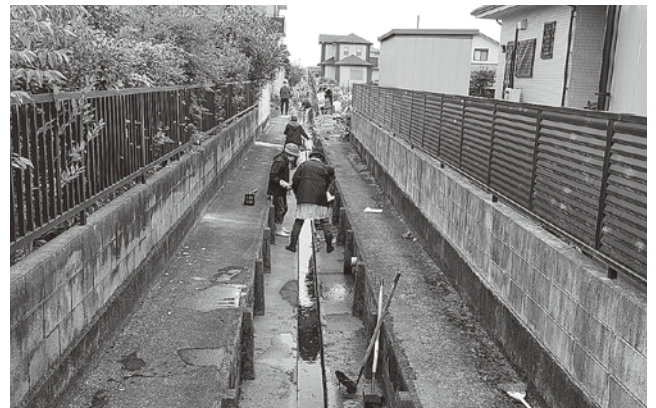
地域の排水路の清掃の様子

答 町長 参加した店舗の人たちが税込アップし、間接的に町に税金を納めていただき財政的にプラスになると思う。