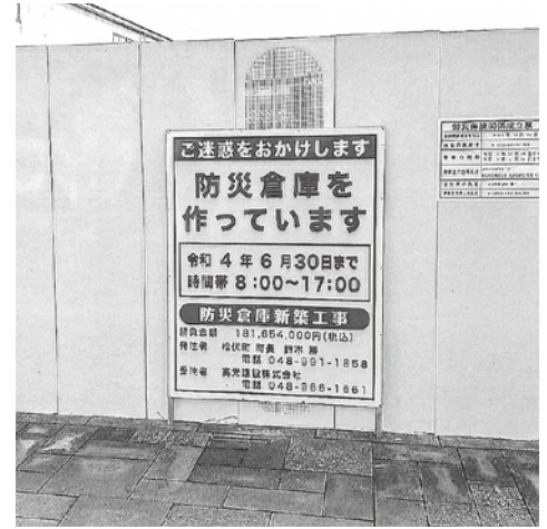
防災倉庫建築中 令和3年12月現在

集団接種会場運營業務委託料の計上及び新型コロナウイルスワクチン接種委託料の増加等に伴い、予算を補正するもの