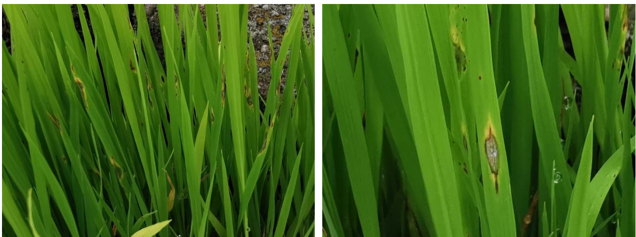
写真1 麦あと栽培ほ場の置き苗に発生したいもち病(進展型病斑) (R3. 7. 1撮影)

※BLASTAMは気象庁のアメダスデータを用いて、イネの葉湿潤時間を計算し、葉いもちの感染しやすい条件を推定するシステムです。