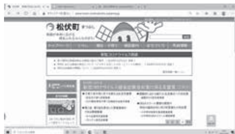
松伏町のホームページ（トップページ）

答 教育長 ICTを活用した学校教育の推進は、プラスの面があり、大きな効果が期待できることは間違いないかと思っている。デジタル教科書については、かなり問題があるのではないかとされており、国の動向を見極めながら対応していくかと思っている。