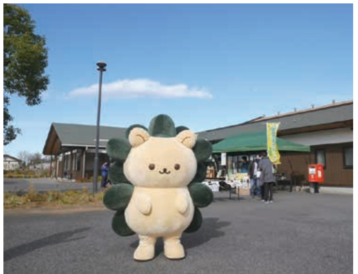
12月19日県営まつぶし緑の丘公園で行われた みどりんと松伏ふるさとカレー販売会