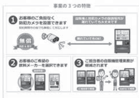
自動販売機の売り上げを基に防犯カメラの設置 (一般社団法人安全・安心まちづくりICT推進機構資料)