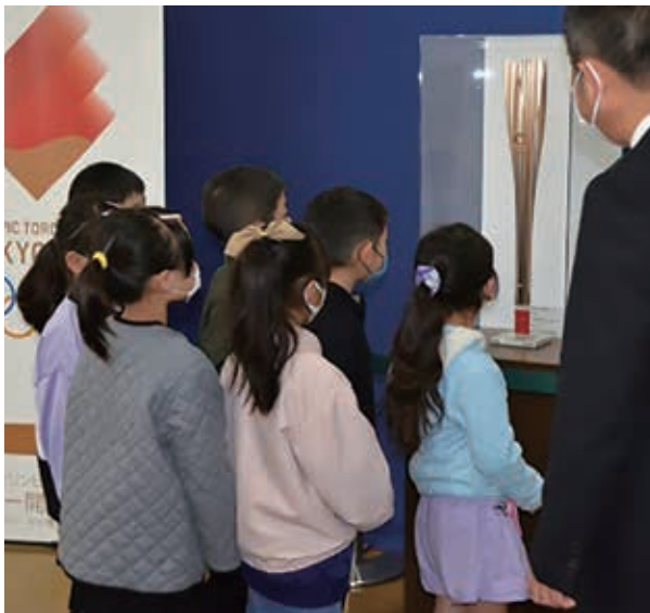
11月5日役場ロビーに展示された 東京2020オリンピック聖火リレートーチ