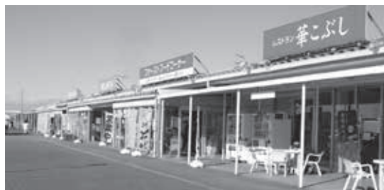
4車線で通行量も多い新4号バイパス沿いの「道の駅ごか」。圏央道のI.C.も近く来場者も多いが、松伏町とは立地条件が大きく違うと痛感

答 町長 道の駅をつくることにより、あの町に転入してみたいと、机上の上に松伏町の名前が挙がってくる。道の駅は公共施設で、儲けだけが道の駅ではない。もちろん赤字を出さないようにする。