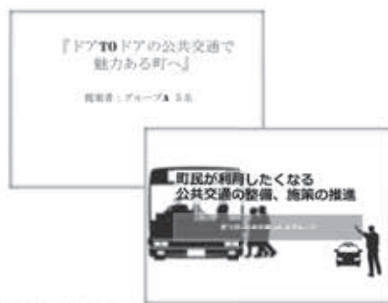
令和2年度に開催された町民からの公募委員による研究会「まつぶし公共交通Lab.」の発表資料