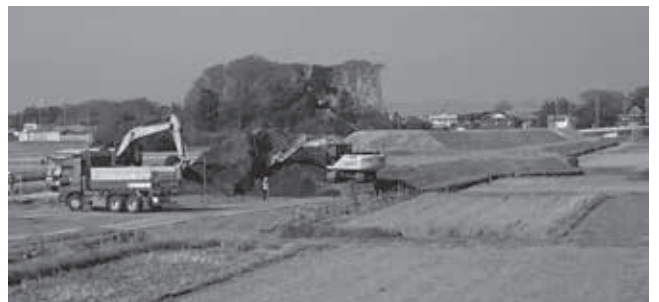
整備工事が進む東埼玉道路側道（大川戸・松ノ木橋付近）

答 教育総務課長 スクールゾーンは、小学校を中心に半径500メートルの範囲で設定できる。交通規制については埼玉県公安委員会の判断となるので、引き続き警察と連携し、児童生徒、住民の安全確保を図っていく。