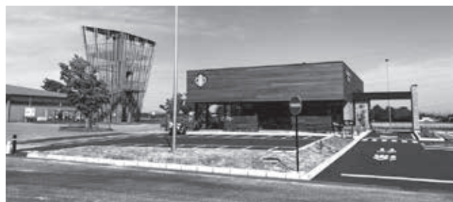
先進事例「道の駅しもつけ」

答 町長 道の駅と鉄道ができれば田島地区は、全国でも珍しくなるのではないかと。鉄道に最も近い、駅から歩ける道の駅が出来て、集客性も増す。