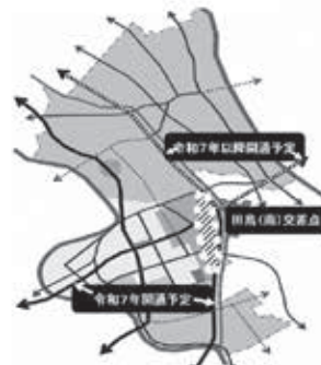
図1: 道の駅建設予定エリア

問 ④地域資源を発信・PRする駅づくりとは。 答 新市街地整備課長 町内施設（まつぶし緑の丘公園等）、景色（古利根川沿いの桜並木等）、活動（エローラでのコンサート等）、人（故後藤純男画伯、プロゴルファー石川遼選手等）といった町の貴重な資源であり、これから作ろうとしている道の駅も地域資源となりうると考える。