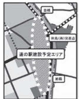
図2: (拡大図)道の駅建設予定エリア 〔路線エリア内のどこかに建設される予定〕