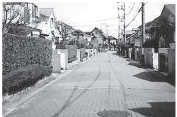
都市計画で建てられたゆめみ野団地

大、縮小の可能性を検討している。特に市街地が拡大傾向にある地域などについては、増加人口が現状の市街地で収容しきれないことが明らかである場合に検討されている。