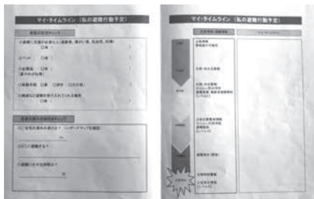
マイ・タイムライン

答 町長 日高市や川島町、その他のところでも、どのような形でやっているのか鋭意研究していく。