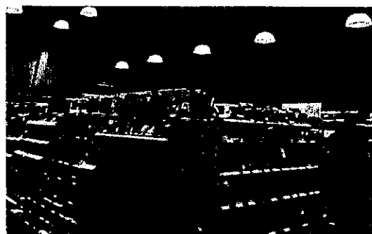
24時間営業のコンビニエンスストア