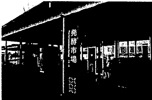
発酵のまちをアピール

「道の駅 発酵の里こうざき」は2015年4月にオープンした。日本の発酵文化を世界に伝える施設として高い評価を受け、「重点道の駅」に指定されている。面積は14,200m 2 、総工費は約10億円、開所初年度は売上約4億円で赤字であったが、2年目以降黒字化し昨年度の売上は7億6千万、来場者は約80万人だったとのこと。人口減少の中、町おこしとして地元の300年以上の伝統を持つ2つの酒造会社を核に、酒蔵から町中に「発酵の里」づくり、「発酵の里こうざき酒蔵まつり」が始まった。後日、道の駅構想が始まって「発酵の里づくり」と融合して、地元の日本酒にはじまる発酵食品のみならず、全国の発酵食品を取り揃えた道の駅として営業を始めたとのこと。道の駅に併設されているコンビニエンスストアは24時間オープンで施設のセキュリティーに役立っており、またシャワー設備も備えてトラック運転者の利便性に配慮している。