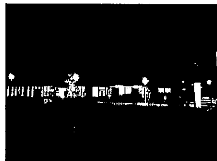
台風15号による停電時(自家発電により電力確保)

この道の駅は温泉施設「つどいの湯」を備えており、地域の住民がつどい憩える、健康をテーマにした道の駅である。防災機能も備え、芝生の防災広場はヘリポートともなり、防災倉庫やかまどベンチが備わっている。レストランはイタリアンの一流のシェフが運営しているとのこと。おしゃれな店舗で新鮮な野菜サラダ付きパスタが定番のようだ。料理に使われるオリーブ油も自家栽培をを目指してオリーブの木が植えられ、オリーブの搾油機も設置されている。ドックランは中・大型犬用と小型犬用が分離設置されている。バーベキューの施設もあって目的型の道の駅を目指しているとのこと。サイクルステーションもある。道の駅の総面積は約2ha。駐車場台数は140台で、平日にもかかわらず、ある程度の賑わいを見せていた。売店には新鮮な地元野菜や草花などが販売され、温泉を楽しむ客が近隣から来られているとのことであった。