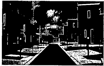
スマートウェルネスタウン

道の駅に隣接して地域優良賃貸住宅「むすざわスマートウェルネスタウン住宅」を備えて流入人口の増加を図っている。敷地面積は約8,990㎡、2階建戸建住宅25戸、平屋建戸建住宅3戸、2階建テラスハウス5戸。20年間の賃貸契約で20年間住み続けると建物が所有できるようにして、長期定住化を目指した住宅街となっている。