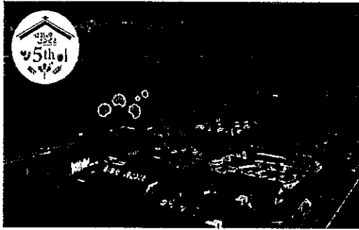
道の駅 発酵の里こうざき

「道の駅 むつざわ つどいの郷」に続き、千葉県香取郡神崎町にある「道の駅 発酵の里こうざき」を視察した。圏央道神崎I.C.に近く、利根川に並行する国道356号線沿いの近くにある。神崎町は人口5,715人(2020年10月1日推計値)、面積は19.9Km 2 で松伏町よりやや大きい。江戸時代には利根川の水運で栄え、醸造関連遺産は近代化産業遺産に認定されている。