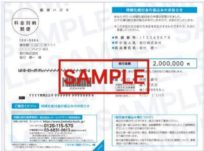
「持続化給付金」給付通知