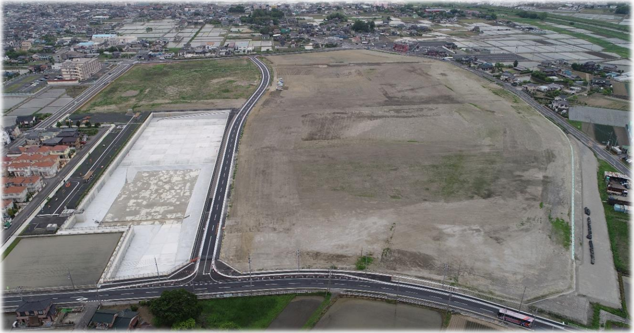
【 松伏田島産業団地を南側から望む 】