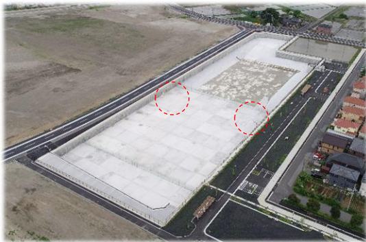
【 調整池を北西側から望む 】