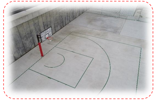
【 3x3 バスケットボールコート 】