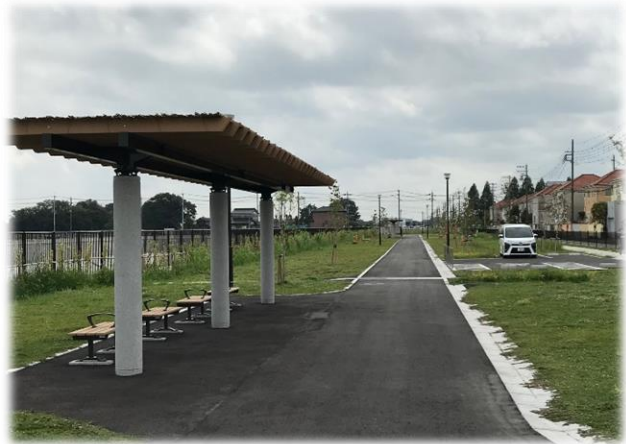
【 田島南公園 】