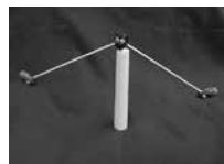
▲どんぐりやじろべい

☎・☎9月14日「どんぐりやじろべい」 9月28日「紙皿水族館」 いずれも土曜日 15:00～15:30 場1階ホール 費無料。直接会場へ。