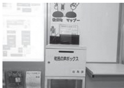
町民の声ボックス

答 新市街地整備課長 設置について経費の部分埼玉県に持っていただきたいので、排水の浄化設備の容量を増すよう県に要望している。