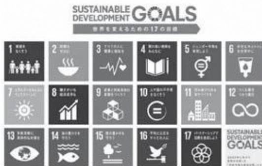
SDGs世界を変えるための17の目標

答 町長 国ではSDGsの理念に沿ったポテンシャルの高い先導的な取り組みを支援することとしている。こうした動きもあり、総合振興計画との整合性をとって、SDGs達成のための取り組みをして、今後とも地方創生に取り組んでいきたい。