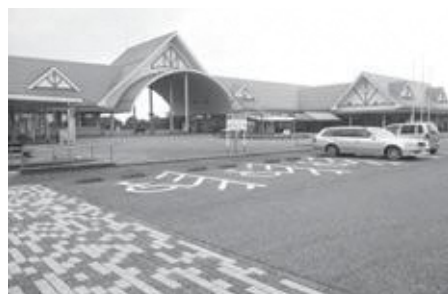
杉戸町の道の駅「アグリパークすぎと」

答 新市街地整備課長 バスターミナル併設の道の駅で地域活性化の拠点として利活用したい。事業の可否は、意見を伺い実施したいと考えている。