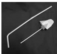
▲飛び出せストローロケット