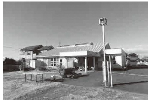
松伏町立かるがもセンター

答 条例では原則公募となっているが、公募によらずとも選定できるとの条項もある。公募しなかったことにより指定管理料は精算方式で対応する。