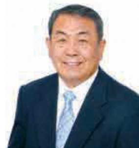
松伏町長 鈴木 勝