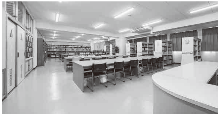
改修された後の第二中学校図書室