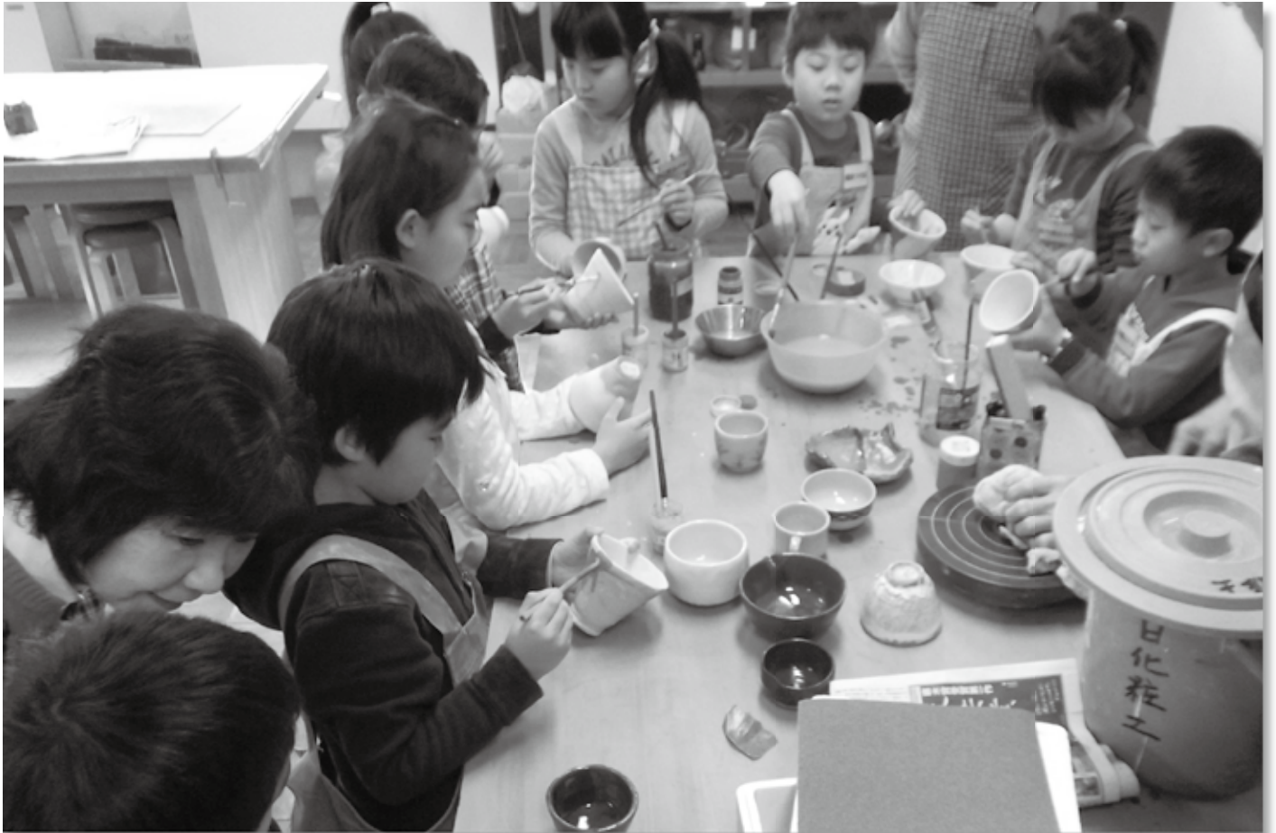
すてきなお茶碗ができたかな(中央公民館工芸室)