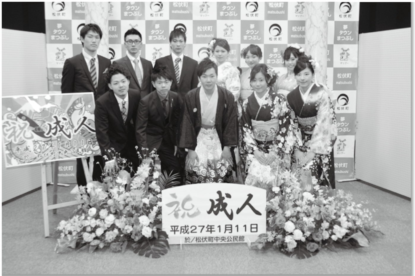
「平成27年成人を祝う会」が開催されました。写真は、実行委員の皆さんです。(田園ホール・エローラ) ▶詳細は9ページ