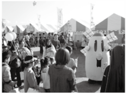
世界キャラクターさみっとin羽生に参加！(平成26年11月)