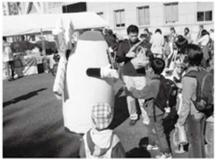
県庁オープンデーでじゃんけん大会！(平成26年11月)