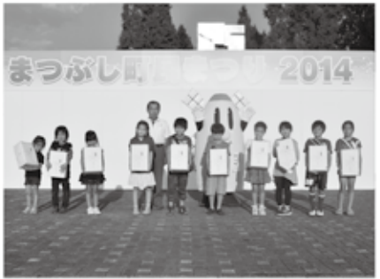
初代まつぶしクイズ王との記念撮影！(平成26年10月)

明けましておめでとうございます！ お出かけ予定は、ぼくのサイトでお知らせするよ～ 僕を見つけて、じゃんけんやハグして遊ぼうね！