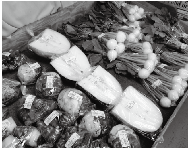
朝採りの新鮮野菜を販売

また、町内の事業所にもご協力いただき、松伏町産農産物を使った商品の開発等に取り組んでいただいています。