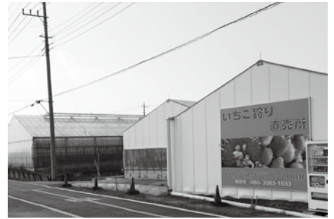
(株)あぐりスタジアム (農業法人としていちごの生産、販売を始めています)

このような法人化により経営規模を拡大することで、農産物の生産・加工・販売を行うことが可能となり、経営の多角化である6次産業化に繋がっていきます。