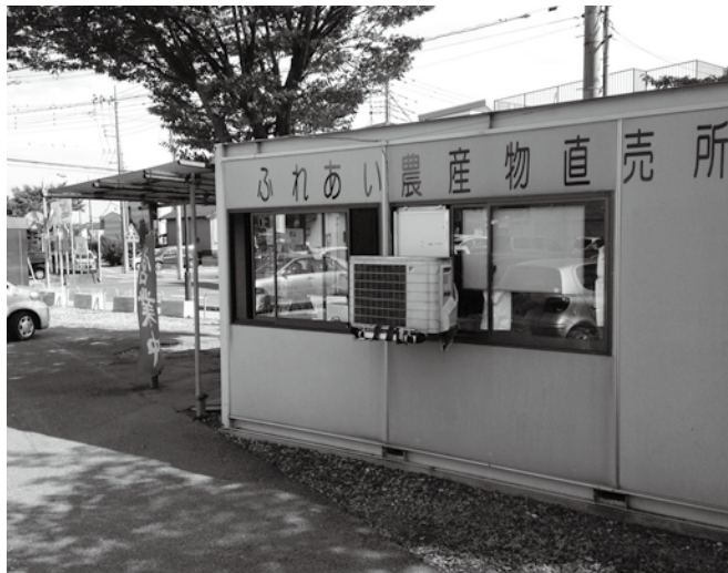
役場敷地内の直売所

直売所は、町内の農業者が自ら運営しており、農産物などの販売をはじめとして農業者と消費者の交流の場となっています。現在、さらなる地産地消活動を進めていくため、JAさいかつ松伏支店敷地内に、直売所を移転し、新たに開店する準備をしています。