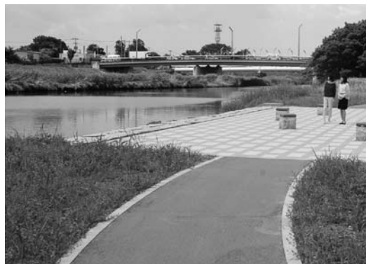
ふれあい橋下流の遊歩道