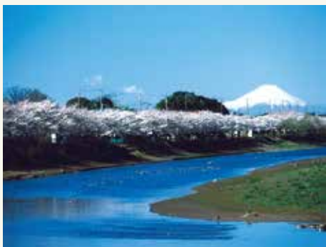
堂面橋から見る桜並木と富士山

松伏町の西側を流れる大落古利根川の遊歩道を歩くコースです。対岸は越谷市となります。北部の大川戸地区から南部の下赤岩地区までほぼ全てのコースが車の通らない遊歩道となっていますので、安全に安心して散歩することができます。コース付近には4つの橋があり、見比べてみるのも面白いかもしれません。季節にもよりますが、北部の蓮の群生、中部の桜並木の桜、南部のからし菜の群生などを見ることができます。また、冬季にはカモなどが川辺で羽を休めており、バードウォッチングにも最適なコースです。