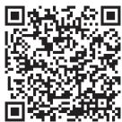
携帯サイトQRコード

URL http://www.mobile.pref.saitama.lg.jp/?page=4845