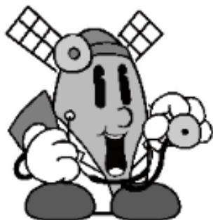
けんこう大使 マッパー